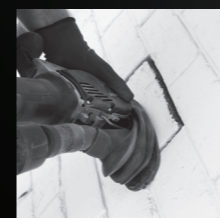
AUSSCHNEIDEN VON BACKSTEINEN