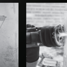
STAUBABSAUGUNG GEGEN GIFTIGEN FEINSTAUB