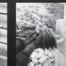
SCHNELLES & EINFACHES AUSSCHNEIDEN